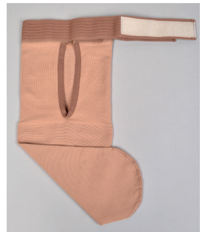
N452A1 / N452A2 (tibial)