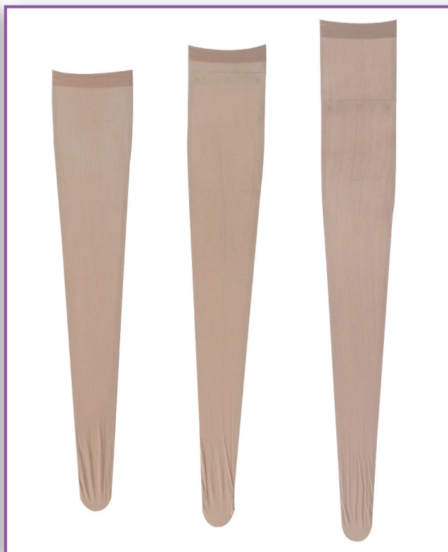
Réf. : TCSSA(35, 38 ou 41)