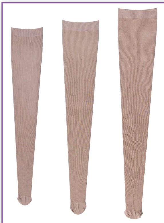
Réf. : TCSRA(35, 38 ou 41)