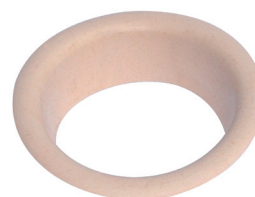
Réf. : TRCO